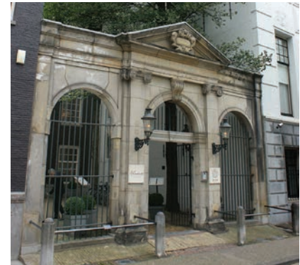
> Keizersgracht 384