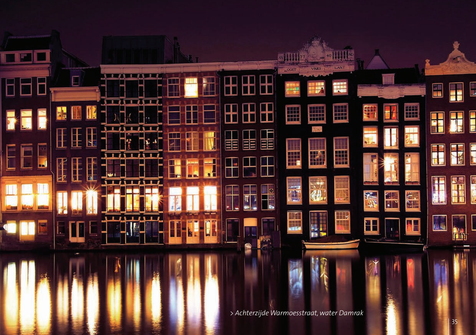
> Achterzijde Warmoesstraat, water Damrak