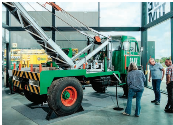
> Saan Museum