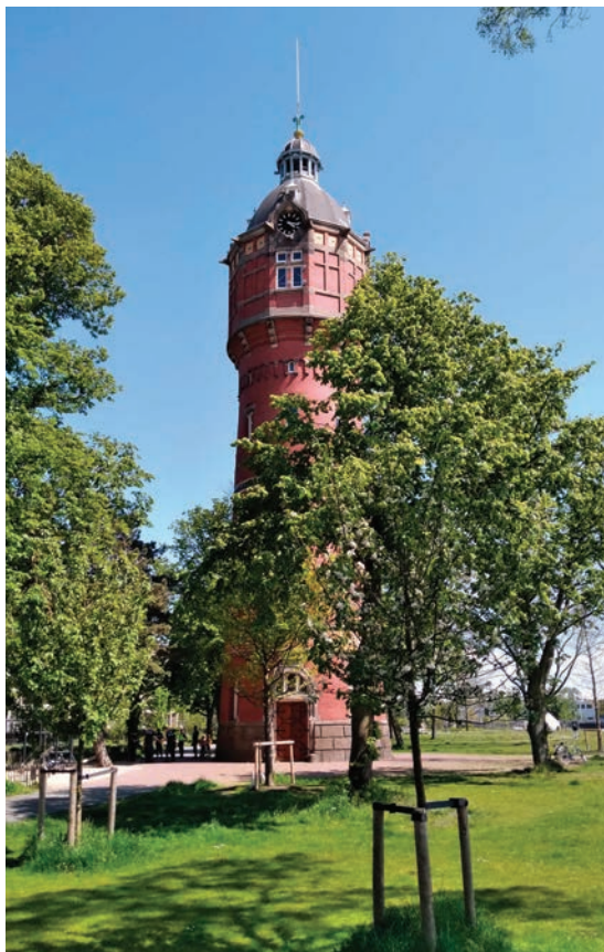
> Bella Vistapark en watertoren Zuidergasfabriek

De wandeling combineert rijke industriële geschiedenis met architectuur van nu en aandacht voor duurzaam bouwen. Het Amstelkwartier ligt even voorbij het Amstelstation, het ‘Bajeskwartier’ tussen metro, trein