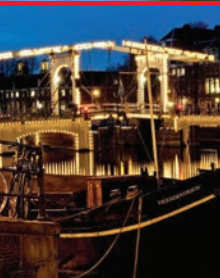
Vereniging Ons Amsterdam