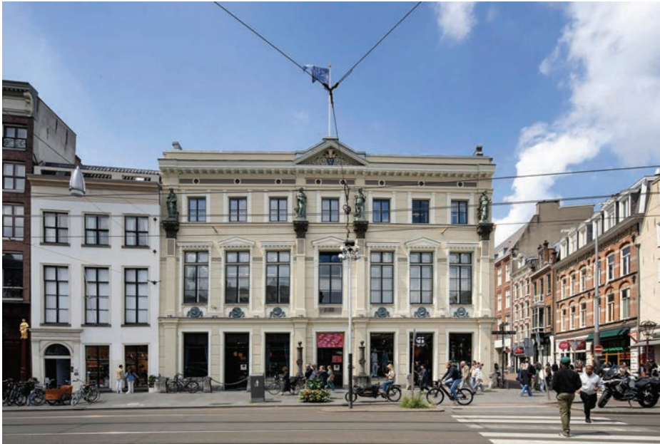
> Arti et Amicitiae

op heden niet veranderd. In 2023 begonnen herstelwerkzaamheden aan de gevels en energetische verbeteringen met behoud van de monumentale waarde.