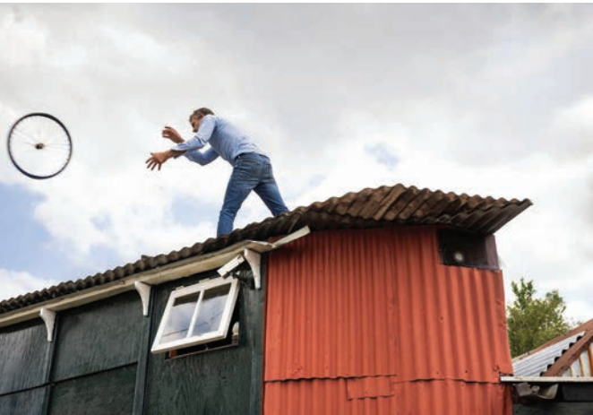
> Havenstratterrein, foto Daniel Nicolas'

Fotograaf Daniel Nicolas heeft twee jaar lang het Havenstratterrein, en iedereen die er woonde of werkte, gefotografeerd. Hij heeft er een fotoboek ISLAND over uitgegeven, dat die avond ook te koop is.