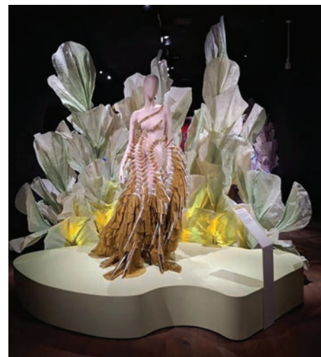
> Oceanista, foto Herman Wals

De tijdelijke modetentoonstelling Oceanista - Fashion & Sea, verbindt op meeslepende wijze het maritieme verleden, het modebeeld van nu en de duurzame toekomst van kleding met elkaar.