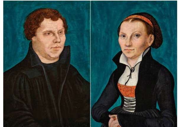
> Portret van Katharina von Bora en Martin Luther

De vele gezichten van Katharina gaat over ons beeld van vrouwen in de loop van de tijd. Iedere tijd zoekt in het verleden naar voorbeelden en rolmodellen. Soms is er maar weinig bekend over een historisch persoon. Juist