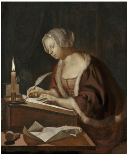
> Schilderij van jonge vrouw die een brief schrijft, Frans van Mieris

zonder aan haar brief is dat deze inzicht biedt in de werkzaamheden op praktisch niveau van een 41-jarige Amsterdamse, die al een bewogen leven achter de rug had.