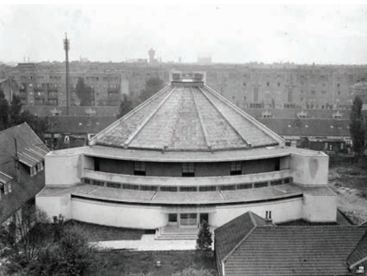
> Tempel van de Theosofische vereniging. Foto Het Vrije Volk, 1931

De Nieuwe Pijp is het gedeelte van het Quartier Latin van Amsterdam bezuiden de Rustenburgerstraat, dat