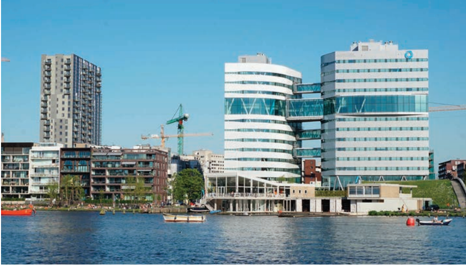
> Hoofdkantoor Waternet

begin november 2023 een bijna-ramp zich voordeed in Amsterdam. De sluisdeuren in IJmuiden gingen niet dicht, de vloed kwam op en het waterpeil van het Noordzeekanaal en de grachten steeg plotseling sterk. Door ingrijpen van zijn afdeling is Amsterdam voor een ramp behoed. Maar hoe werkt de Amsterdamse waterhuishouding? Wat weten we nog van het verleden? En wat staat ons te wachten in de toekomst?