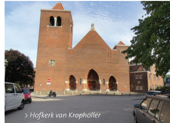
> Hofkerk van Kropholler

bijna een halve eeuw in Amsterdam. Hij was van 1990 tot 2025 redacteur van NRC Handelsblad en is nog altijd als medewerker architectuur verbonden aan deze krant. Hij schreef verschil-