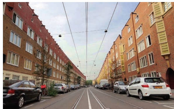
> Witte de Withstraat

Vanaf 1850 krabbelde Amsterdam economisch op en de bevolking groeide. Het stadsbestuur was daar niet op voorbereid. Pas in 1877 werd een uitbreidingsplan vastgesteld. In de periode daarna maakte Amsterdam een spectaculaire groei door. Rond de stad verscheen een ring van wijken met 135.000 nieuwe woningen. 75% van deze volkswoningbouw verrees in opdracht van project-