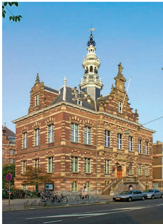
> Raadhuis Nieuwer-Amstel

De Nieuwe Pijp is het gedeelte van het 'Quartier Latin van Amsterdam' bezuiden de Rustenburgerstraat, dat tot 1896 tot het grondgebied van Nieuwer-Amstel behoorde. Behalve dat zich in De Pijp van meet af aan enorm veel schrijvers en kunstenaars vestigden, vanwege de nabijheid van de Rijksacademie en omdat de huren er zo hoog waren dat bewoners zoveel mogelijk kamers verhuurden, werden er vanaf de Woningwet van 1902 grote blokken arbeiderswoningen neergezet, ook in de eerste fase van Berlages Plan-Zuid.